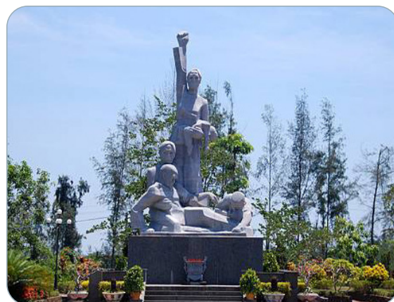
Hình 2.6. Tượng đài tại Khu Chứng tích Sơn Mỹ (thành phố Quảng Ngãi)