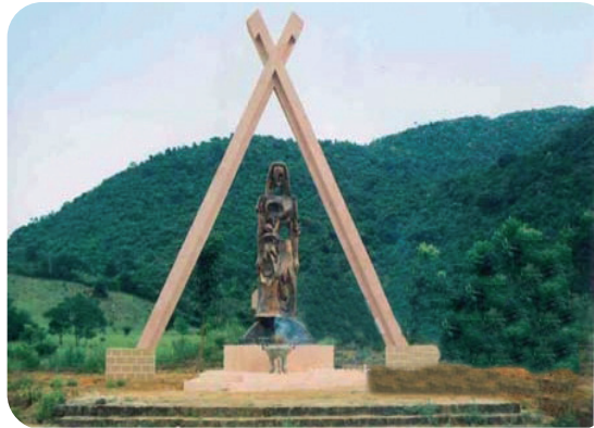
Hình 2.2. Tượng đài tưởng niệm vụ thâm sát Khánh Giang – Trường Lệ (huyện Nghĩa Hành)