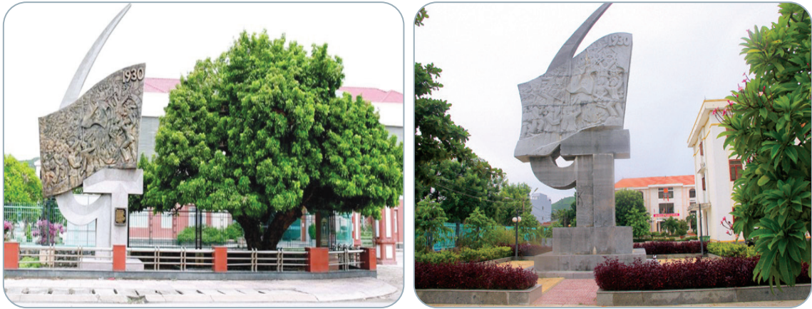
Hình 2.8. Di tích lịch sử cách mạng Huyện đường Đức Phổ