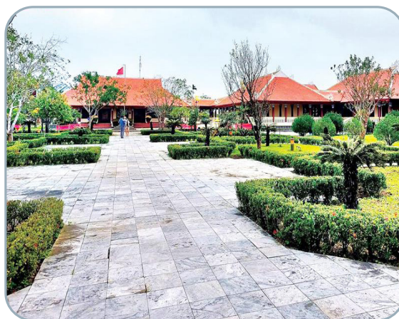
Hình 2.4. Khu Lưu niệm Thủ tướng Phạm Văn Đồng (huyện Mộ Đức)