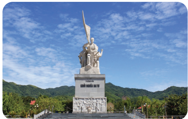
Hình 2.9. Tượng đài khởi nghĩa Ba Tơ

Vào năm 1985, khu trung tâm diễn ra cuộc khởi nghĩa đã được tỉnh Quảng Ngãi xây dựng nhà Bảo tàng Khởi nghĩa Ba Tơ. Các địa điểm khác như: khúc Sông Liên, dốc Ông Tài, Suối Loa, Hang Én, hang Voọc Rệp, Nha Kiểm lý,... được giữ gìn, tôn tạo, phát huy tinh thần cách mạng, truyền thống yêu nước của nhân dân Quảng Ngãi. Quần thể các địa điểm di tích về cuộc khởi nghĩa Ba Tơ và Đội Du kích Ba Tơ được Bộ Văn hoá – Thông tin công nhận, xếp hạng và cấp Bằng di tích lịch sử – văn hoá quốc gia tại Quyết định số 92-VH/TT/QĐ ngày 10/7/1980.