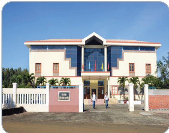
Hình 2.11. Bảo tàng chiến thắng Vạn Tường