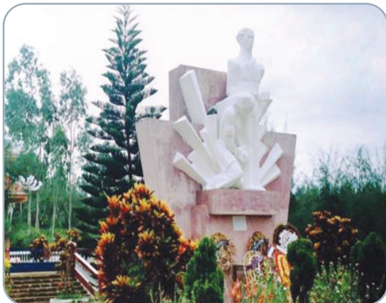
Hình 2.10. Tượng đài chiến thắng Vạn Tường