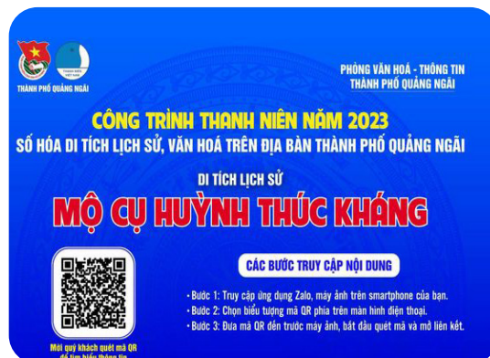
Hình 2.7. Công trình thanh niên năm 2023 số hoá di tích lịch sử mộ cụ Huỳnh Thúc Kháng (thành phố Quảng Ngãi)

Thực hiện Nghị quyết số 13-NQ/TU ngày 6/9/2023 của Ban Thường vụ Tỉnh uỷ khoá XX về chuyển đổi số tỉnh Quảng Ngãi đến năm 2025, định hướng đến năm 2030, các cơ sở đoàn trên địa bàn tỉnh đã tổ chức thực hiện công trình thanh niên “Số hoá di tích lịch sử, văn hoá”. Đây là hoạt động ý nghĩa nhằm cung cấp chính xác dữ liệu, hình ảnh, tài liệu liên quan đến các khu di tích, địa chỉ đỏ, danh lam thắng cảnh. Qua đó, tuyên truyền, quảng bá các giá trị văn hoá, lịch sử của quê hương và thúc đẩy chuyển đổi số trong lĩnh vực văn hoá, du lịch.