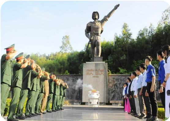
Hình 2.1. Tượng đài chiến thắng Ba Gia (huyện Sơn Tịnh)

Vùng đất Quảng Ngãi là một chiến trường ác liệt trong hai cuộc kháng chiến chống Pháp và chống Mỹ của dân tộc ta. Trải qua bao thăng trầm của lịch sử, ngày nay vẫn còn nhiều di tích lưu dấu những chiến thắng oanh liệt, vẻ vang, những đau thương mất mát trong sự nghiệp đấu tranh giải phóng dân tộc. Những di tích lịch sử ở Quảng Ngãi không chỉ là nơi để tìm hiểu về quá khứ, về chiến tranh mà còn là nơi bồi dưỡng, giáo dục truyền thống cách mạng và tình yêu quê hương, đất nước.